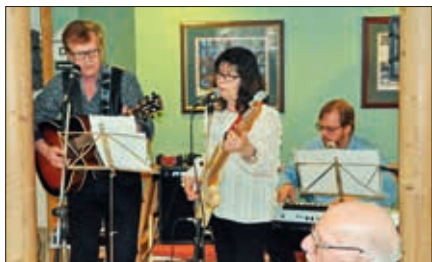
Evangelievennene sang og spilte på vårens ettermiddagskaffe på Furumoen.

Diakoniforeningen ser det å arrangere ettermiddagssamlinger på de forskjellige institusjonene i Sauherad som en av sine viktigste oppga-