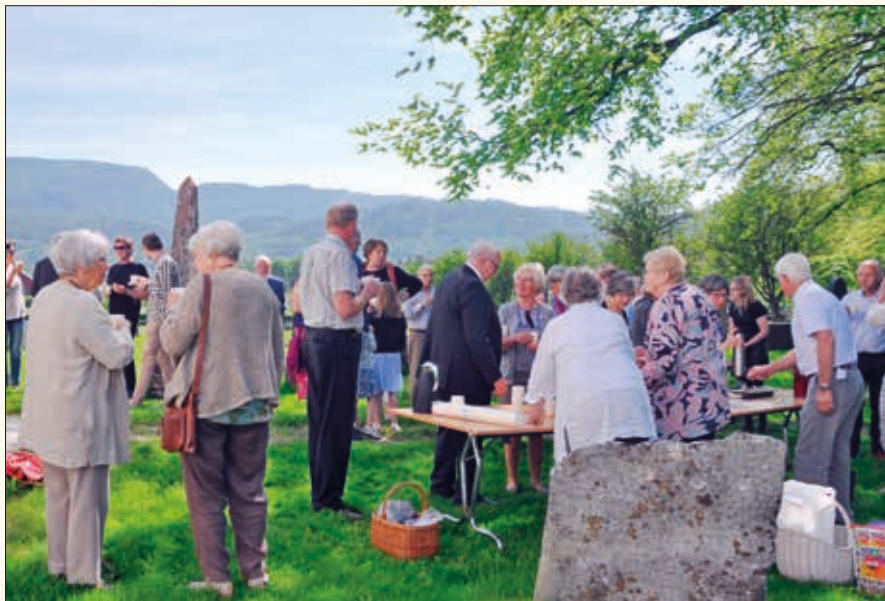
Menighetens misjonsutvalg hadde ansvar for kirkebakkekaffen.