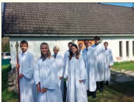
Her er konfirmantene på den andre gruppa i Nes kyrkje.