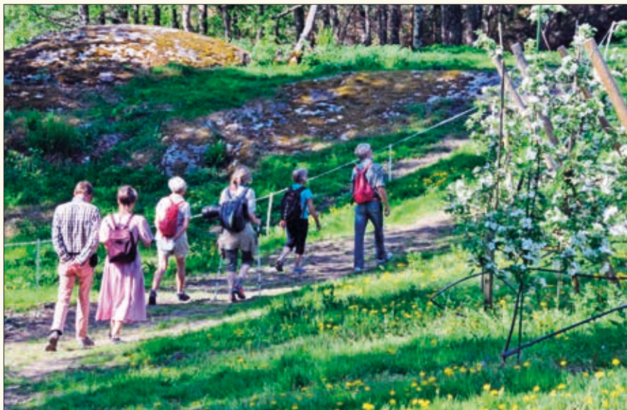
I omtalen av pilegrimsvandringa fra Nes kyrkje til Bø gamle kyrkje står det at det er ei vandring i et frodig landskap. Man hadde ikkje tatt munnen for full!