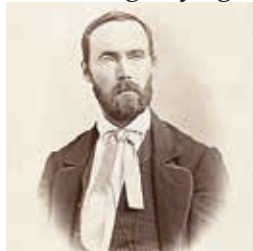
Aa. O. Vinje (1818 – 1870)

I år er det 200 år siden Aasmund Olavsson Vinje ble født. Olav Nordstoga forteller om dikteren. Ellen Bojer Nordstoga synger tekster av Vinje.