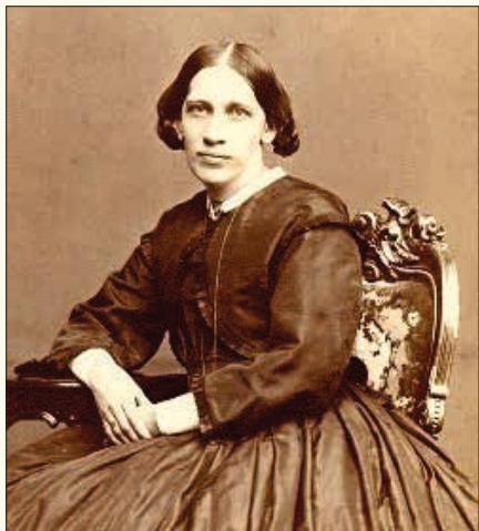
Lina Sandell, (1932 – 1903).