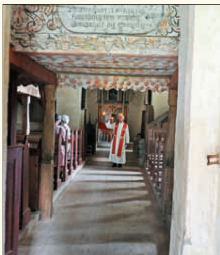
Alle som ønsket kunne delta på avslutning av vandringen i Bø gamle kyrkje. Sokneprest Axel Bugge var liturg.