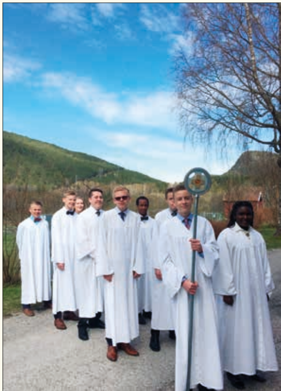
Konfirmantene i Sauherad lørdag 5. mai klare til inngangsprosesjonen.