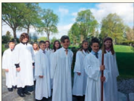
I Nes kyrkje var det konfirmasjon lørdag 12. mai. Her er første gruppe på vei inn i kirka.