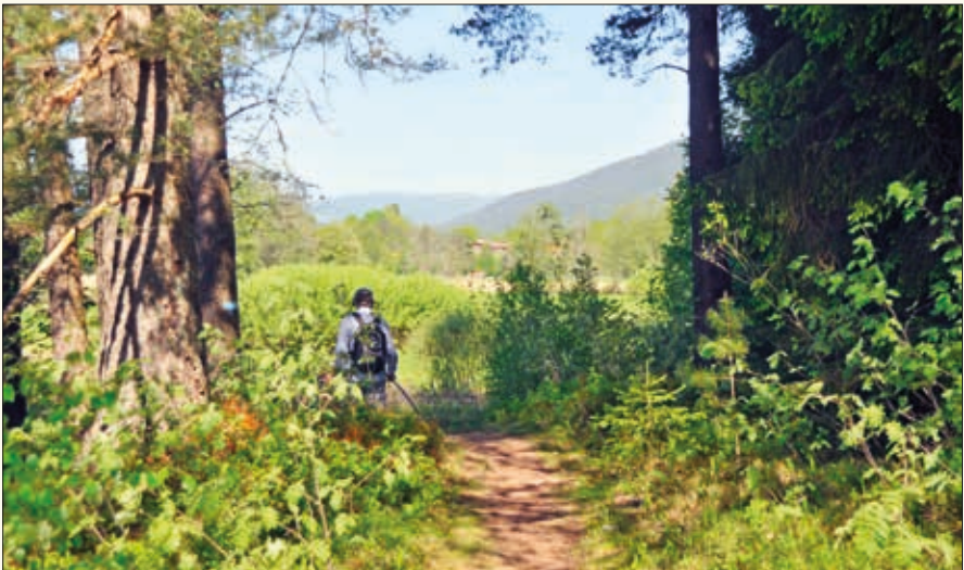
Veien fra Gunheim og opp langs elva til Eøju, er et nydelig strekke vei å vandre.