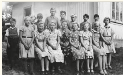
Dette er et skolebilde, men i bakgrunnen ser vi den gamle Sauar skole som ble bedehus på 1950-tallet.