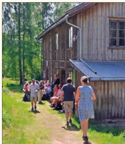
På Hørte Dampfarveri steiker de ikke opp vafler på forhånd, her får du dem rett fra jernet. Mange benyttet seg av dette!